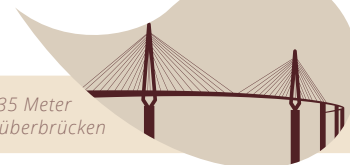
Köhlbrandbrücke · 135 Meter Um die Erkrankung zu überbrücken