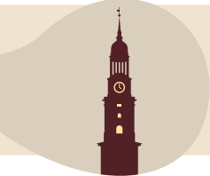
Michel · 132 Meter Für maßgeschneiderte Starthilfe