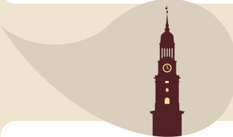
Michel · 132 Meter Für maßgeschneiderte Starthilfe