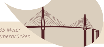
Köhlbrandbrücke · 135 Meter Um die Erkrankung zu überbrücken