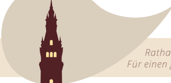
Rathaus · 112 Meter Für einen guten Überblick